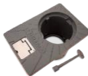
Fixator och lock